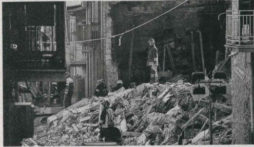
หาผู้รอดชีวิต - เจ้าหน้าที่กู้ภัยกำลังค้นหาผู้รอดชีวิตภายใต้ซากอาคารที่อยู่อาศัยหลายหลังที่ถล่มลงมาเนื่องจากเกิดระเบิดขึ้นที่เมืองจราวานูซา บนเกาะชิลีลี ประเทศชิลี เมื่อวันที่ 13 ธันวาคม ล่าสุด มีผู้เสียชีวิตแล้วอย่างน้อย 7 ราย สาเหตุคาดว่าน่าจะเกิดจากท่อลำเลียงแก๊สของเมืองเกิดการรั่วไหลขึ้น

ยอดติดเชื้อโควิด-19 สะสมทั่วประเทศของสหรัฐอเมริกาพุ่งผ่านหลัก 50 ล้านคนเป็นครั้งแรกเมื่อวันที่ 12 ธันวาคมที่ผ่านมา ทั้งนี้ จากการประมวลข้อมูลของสำนักข่าวรอยเตอร์ ซึ่งระบุว่า เชื้อกลายพันธุ์เดลต้ายังคงเป็นเชื้อโควิด-19 ที่คุกคามคนอเมริกันมากที่สุด อย่างไรก็ตาม เชื้อกลายพันธุ์โอไมครอนซึ่งเพิ่งพบในสหรัฐอเมริกาเมื่อสัปดาห์ที่ผ่านมา ก็เริ่มแพร่กระจายออกไปอย่างรวดเร็ว